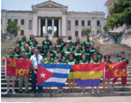
1ª Brigada a Cuba "Antonio Gades"