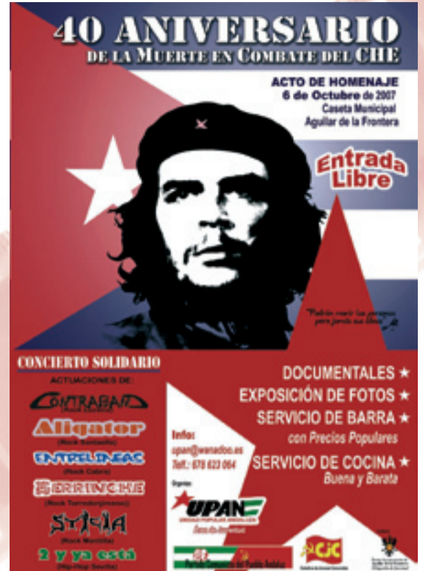
Acto homenaje al Che Guevara el 6 de Octubre en la Caseta Municipal de Aguilar de la Frontera.