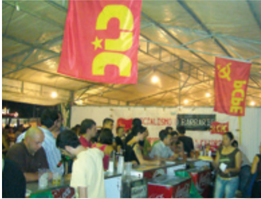
Caseta del PCPE en las fiestas de Alcorcón