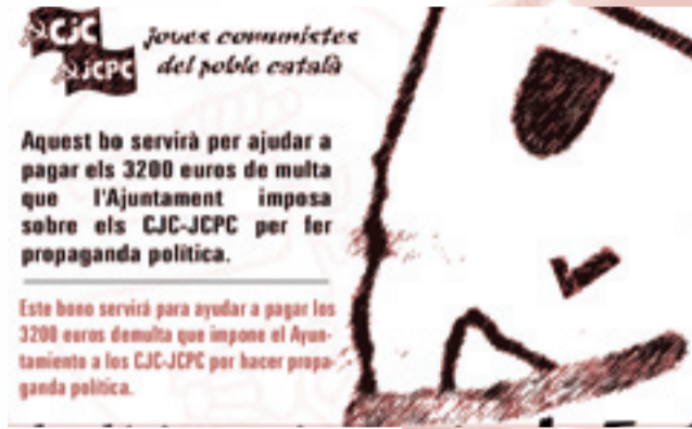
Bono de ayuda para pagar los 3.200 euros de multa que impone el Ayuntamiento de Barcelona sobre los CJC-JCPC