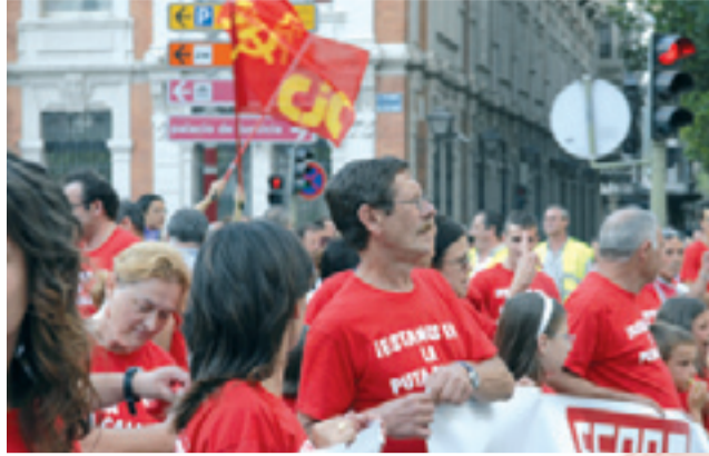
Concentración de Primayor-Albacete donde cerca de 110 trabajadores pueden perder su empleo